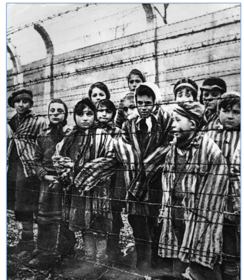
Crianças atrás de uma cerca de arame farpado no campo de concentração nazista de Auschwitz no sul da Polônia.