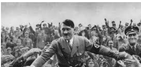
Adolf Hitler (1889-1945) sendo recebido por apoiadores em Nuremberg, em 1933.

4 – Você está lendo o Diário de Anne Frank , que tem como pano de fundo o nazismo. Por qual razão a família de Anne foi perseguida durante esse período? Quais outros grupos eram perseguidos e mortos no nazismo? Por quê? Responda em seu caderno.