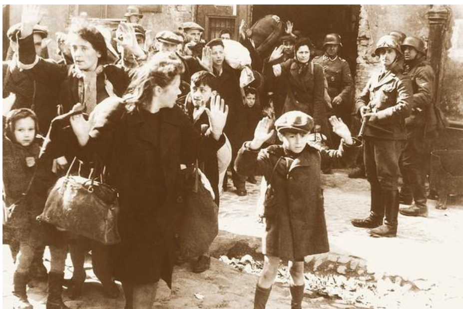
Judeus sendo presos por nazistas

No entanto, as principais vítimas da intolerância nazista foram os judeus. Elevando o já existente antisemitismo 3 a níveis nunca antes experimentados, o Estado alemão implantou um eficiente e desumano sistema de perseguição, exploração e morte de populações judaicas. Com um pouco mais de uma década de existência, o governo de Hitler foi responsável por um dos