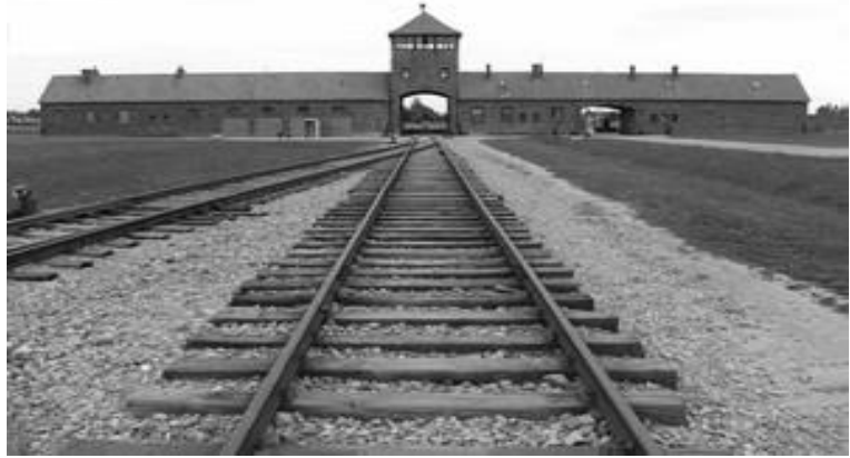
Campo de concentração de Auschwitz

Muitos dos prisioneiros nazistas eram levados aos campos de concentração, onde eram obrigados a trabalhar em benefício do mesmo governo que os perseguia. Quando não mais serviam como mão de obra, eram brutalmente assassinados, principalmente através das pavorosas câmaras de gás, e enterrados em valas coletivas.